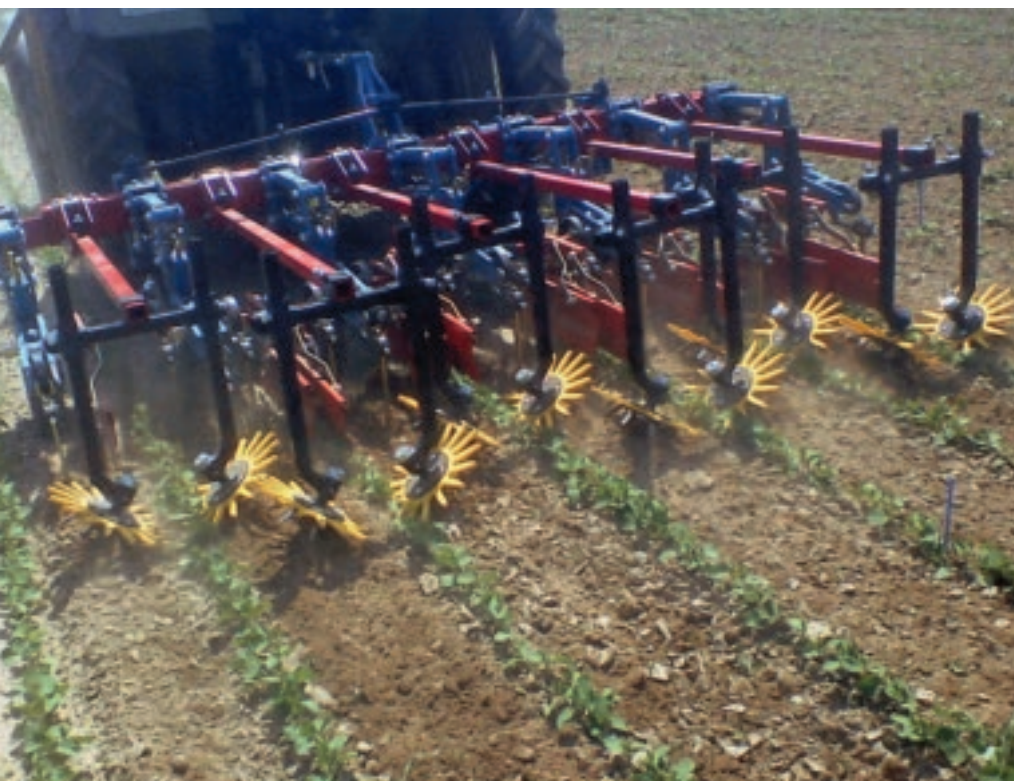
Die Fingerhacke arbeitet in der Reihe.

Deckungsgrad zur Ernte lag die Variante „Striegel solo“ in Stockach sogar gleichauf mit der Kontrolle ohne Beikrautregulierung. Ursache ist die witterungsbedingt relativ späte erste Beikrautregulierung auf beiden Standorten. Der Striegel konnte zu diesem späten Zeitpunkt mit bereits weit entwickelten Pflanzen keine befriedigende Arbeit mehr leisten.