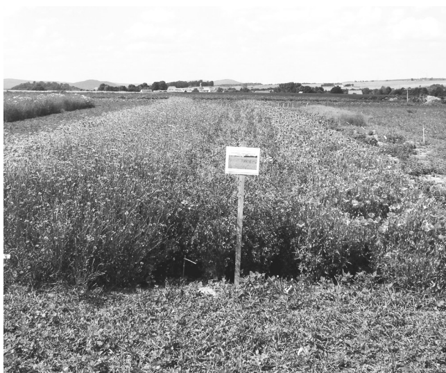
■ Vor der Aussaat auf den Ackerflächen von Biobetrieben muss das Saatgut der autochthonen Ackerwildkräuter vermehrt werden – wie hier auf der Domäne Frankenhäusen in Hessen. (Foto: Carola Hotze)

Als Beweggründe für eine mögliche Teilnahme an Maßnahmen zum Ackerwildkrautschutz nannten die Befragten „Förderung der Artenvielfalt“, „Verantwortung gegenüber Natur und Umwelt“, „Nutzen für den Biobetrieb“ sowie „Freude an Natur und Naturbeobachtung“. Unter „Nutzen für den Biobetrieb“ wurden positive Nebenwirkungen auf Kulturpflanzen, Bodenfruchtbarkeit und auf den Ackerbau allgemein verstanden. Zahlreiche Landwirte hatten sich mit dem Thema bereits auseinandergesetzt. Sie verwiesen zum Beispiel auf eigene Erfahrungen und äußerten Ideen für die Umsetzung. Drei Viertel der Befragten möchten weiter über das Thema informiert werden und sind an Forschungsergebnissen interessiert. Die Antworten weisen darauf hin, dass bereits heute in vielen Biobetrieben fundiertes Praxiswissen zum Ackerwildkrautschutz vorhanden ist.